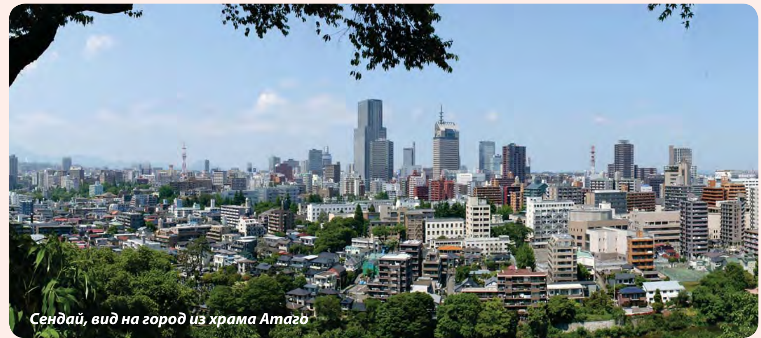
Сендай, вид на город из храма Атаго