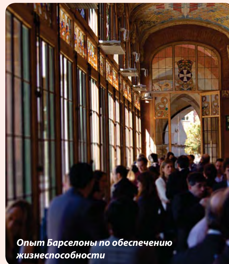
Опыт Барселоны по обеспечению жизнеспособности