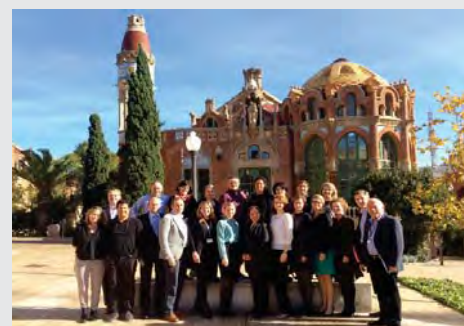
Участники семинара «Медельинского сотрудничества по жизнеспособности городов»

В работе семинара приняли участие более 20 человек, представлявших государственный и частный сектор, включая нескольких членов МСЖГ, в том числе ООН-Хабитат; Управление ООН по снижению опасности стихийных бедствий (ЮНИСДР); Фонд Рокфеллера; инициаторов Фонда Рокфеллера проект «100 жизнеспособных городов»; Всемирный банк; Межамериканский банк развития; Глобальный фонд по уменьшению опасности и восстановлению; лидирующую в борьбе с потеплением климата Группу городов С40 и ИКЛЕИ-Местные органы власти за устойчивое развитие.