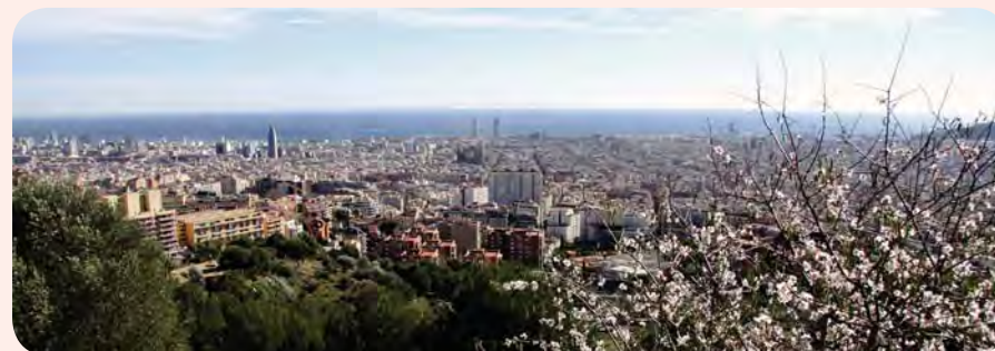
Барселона, Испания

Создание международных объединений и участие в программах, которые являются источником глобальных движущих факторов по укреплению устойчивого развития городов и поддерживают барселонскую модель, таких, например, как ППЖГ ООН-Хабитат, кампания ЮНИСДР «Сделаем города жизнеспособными», сеть Группы городов С40 по оценке рисков в связи с изменением климата, и в самое последнее время – проект «Вызов 100 жизнеспособных городов» Фонда Рокфеллера, все из которых входят в состав группы организаций «Медельинское сотрудничество по жизнеспособности городов», несомненно, способствует укреплению структуры и разработке механизмов, которые служат примером в работе по обеспечению жизнеспособности нашего города. В этом отношении мне хотелось бы особо отметить тесное сотрудничество с находящейся в Барселоне рабочей группой ППЖГ, связанное с составлением описания системного и глобального подхода к измерению показателей степени жизнеспособности, которое в полной мере соответствует нынешней разработке Плана повышения жизнеспособности города и служит важным средством поддержки при определении основных направлений деятельности и планирования мероприятий по снижению уязвимости города.