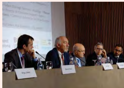
Опыт Барселоны по обеспечению жизнеспособности