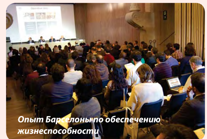
Опыт Барселоны по обеспечению жизнеспособности

В настоящей информационной брошюре кратко излагаются основные положения новой программы ООН Хабитат, в которой приводятся количественные показатели деятельности местных органов власти по повышению жизнеспособности городов.